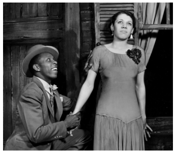
Porgy and Bess

Enfin, nous franchissons l'Atlantique avec George Gershwin et son opéra populaire Porgy and Bess (1935). Avec Summertime , Gershwin réussit le tour de force de créer un « classique » instantané, à la croisée du spiritual , du jazz et de l'opéra savant. Cette ber-