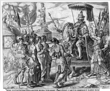
Nabuchodonosor et les esclaves

Le Risorgimento et l'âme italienne : L'épopée chez Verdi S'il est un compositeur dont le nom se confond avec l'identité d'un peuple, c'est Giuseppe Verdi. Dans l'Italie du XIXe siècle, ses