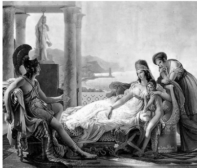
Enée et Didon (musée du Louvre)

Notre parcours débute en Angleterre avec Henry Purcell et son chef-d'œuvre Dido and Aeneas (1689). Composé initialement pour une école de jeunes filles à Chelsea, cet opéra condense en une heure une tragédie d'une intensité rare. Le Chœur des marins (« Come away, fellow sailors ») apporte une touche de réalisme pittoresque et de rudesse avant le dénouement tragique. Il contraste singulièrement avec le chœur « To the hills and the vales », qui appelle à la célébration pastorale. Chez Purcell, le chœur agit comme un commentateur antique, soulignant le caractère inéluctable du destin de la reine de Carthage.